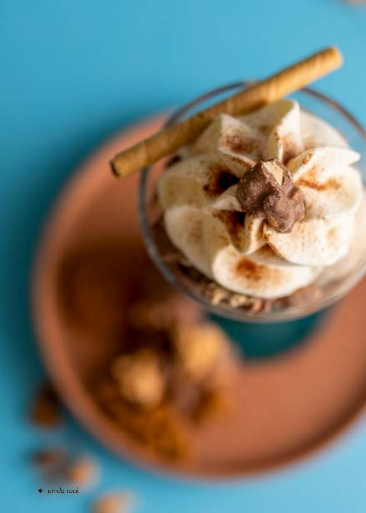
◆ pinda rock